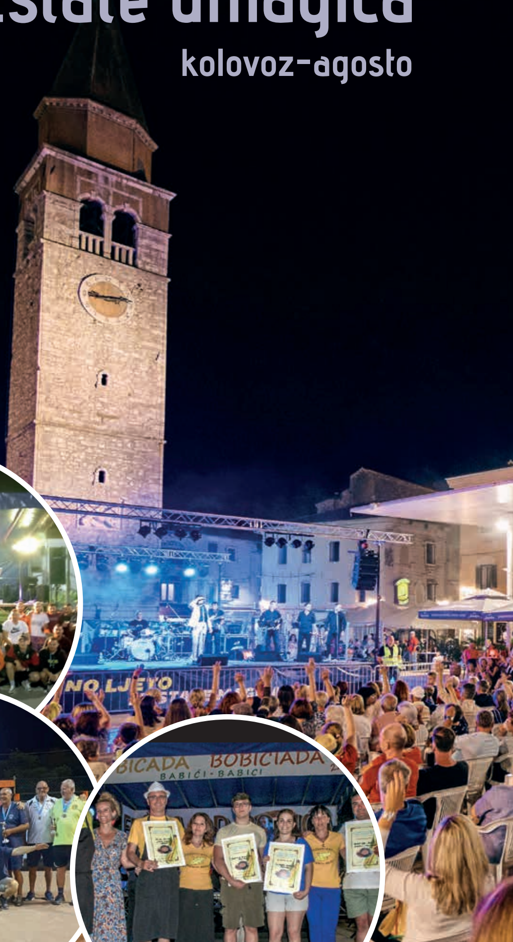
Lovrečica - San Lorenzo